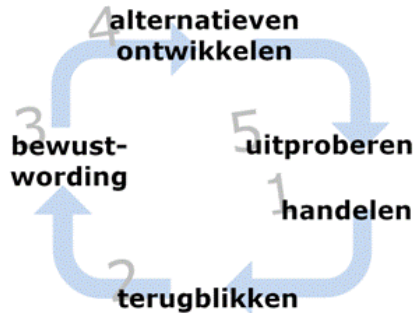
Reflectiecyclus van Korthagen

kunnen dan weer door de leerling worden uitgeprobeerd. Daar kan dan vervolgens weer op worden gereflecteerd.